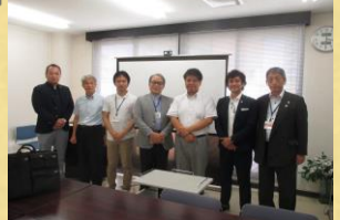
講師を囲んで記念撮影