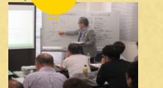
日高支部長事例説明