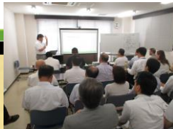
満員状態の研修会場