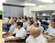
真剣に聴き入る研修生