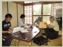
当面の課題の研修計画について協議！