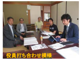
役員打ち合わせ模様