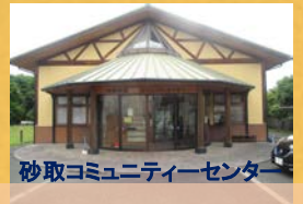
砂取コミュニティーセンター

会員への諸々の資料等の送付は次回6月開催の理事会後に印刷及び発送を行う事と致しました。