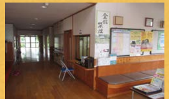
静かな環境の公共施設でした！