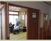
開かれた支部運営に全理事で協議！